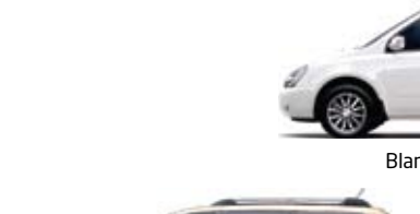
Blanc limpide (TG/CG)