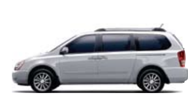
Argent limpide (M) (TG/CG)