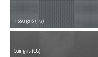
Tissu gris (TG)