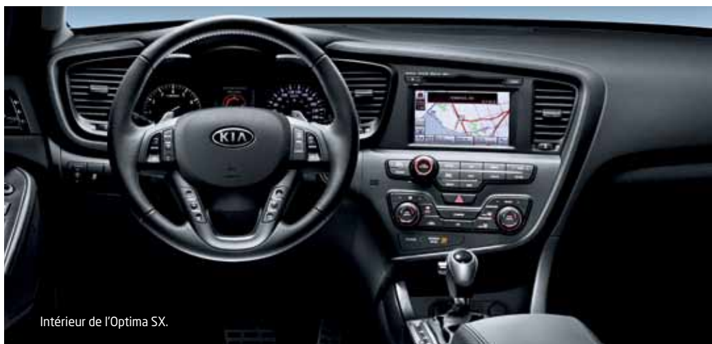
Intérieur de l'Optima SX.

Divertissement et informations. Le système exclusif UVO de Kia fait par Microsoft® 7 est un système d'infodivertissement optionnel à la fine pointe de la technologie, de divertissement, de communication et d'information qui fonctionne par commandes vocales par le biais du système audio de l'Optima, de votre lecteur MP3 et de votre téléphone cellulaire compatible avec la téléphonie Bluetooth®.