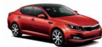
Rouge épice (M)