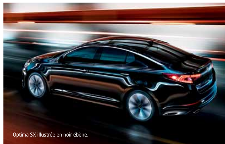
Optima SX illustrée en noir ébène.

L'Optima change les règles du jeu au-delà du design grâce à la puissance de son moteur, son couple et son économie d'essence en tête de catégorie. 4 De plus, l'Optima a reçu la plus haute cote attribuable par la NHSTA et l'IHS lors de tests de résistance aux collisions. 5 C'est un tout autre jeu désormais. Jouez-y à bord de l'Optima 2011 de Kia!