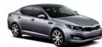
Platine graphite (M)