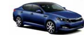
Bleu Santorini (M)