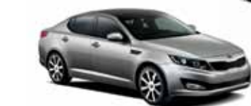
Métal satiné (M)