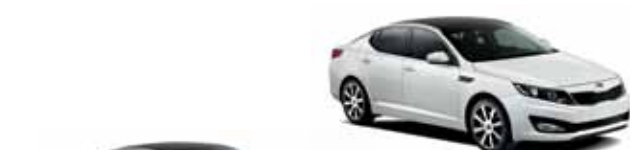
Blanc nacré (P)