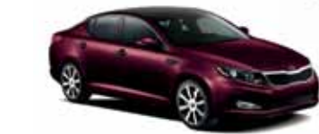
Cerise noir (M)