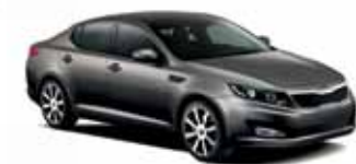
Bronze métallisé (M)