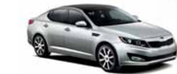
Argent étincelant (M)