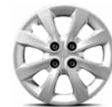
Jantes en acier de 15 po avec enjoliveurs pleine roue