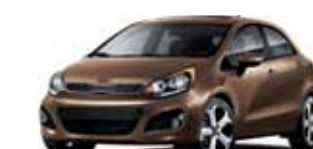
Caramel (N) TN/CC/CB/CN