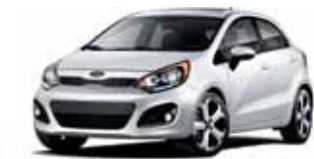
Blanc limpide TN/CC/CB/CN