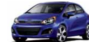
Bleu tanzanite (N) TN/CB/CN