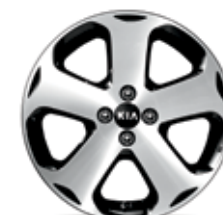
Jantes en alliage de 17 po