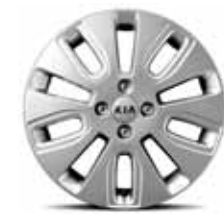
Jantes en alliage de 16 po