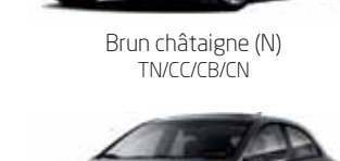
Brun châtaigne (N) TN/CC/CB/CN